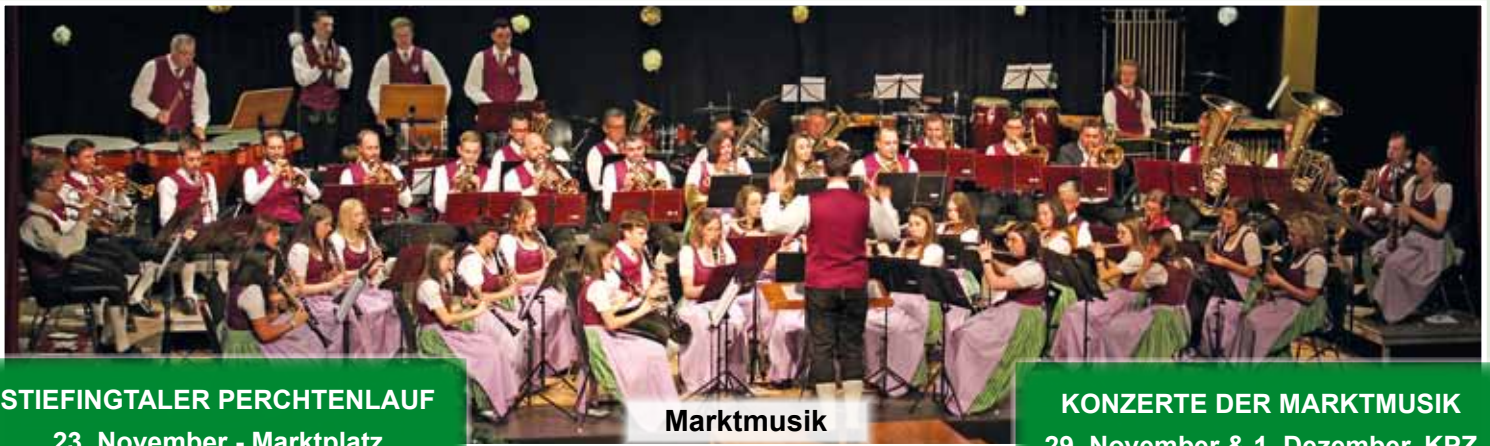
STIEFINGTALER PERCHTENLAUF 23. November - Marktplatz