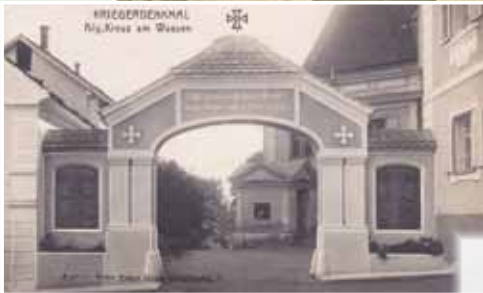
ehem. Kriegerdenkmal Bau 1924