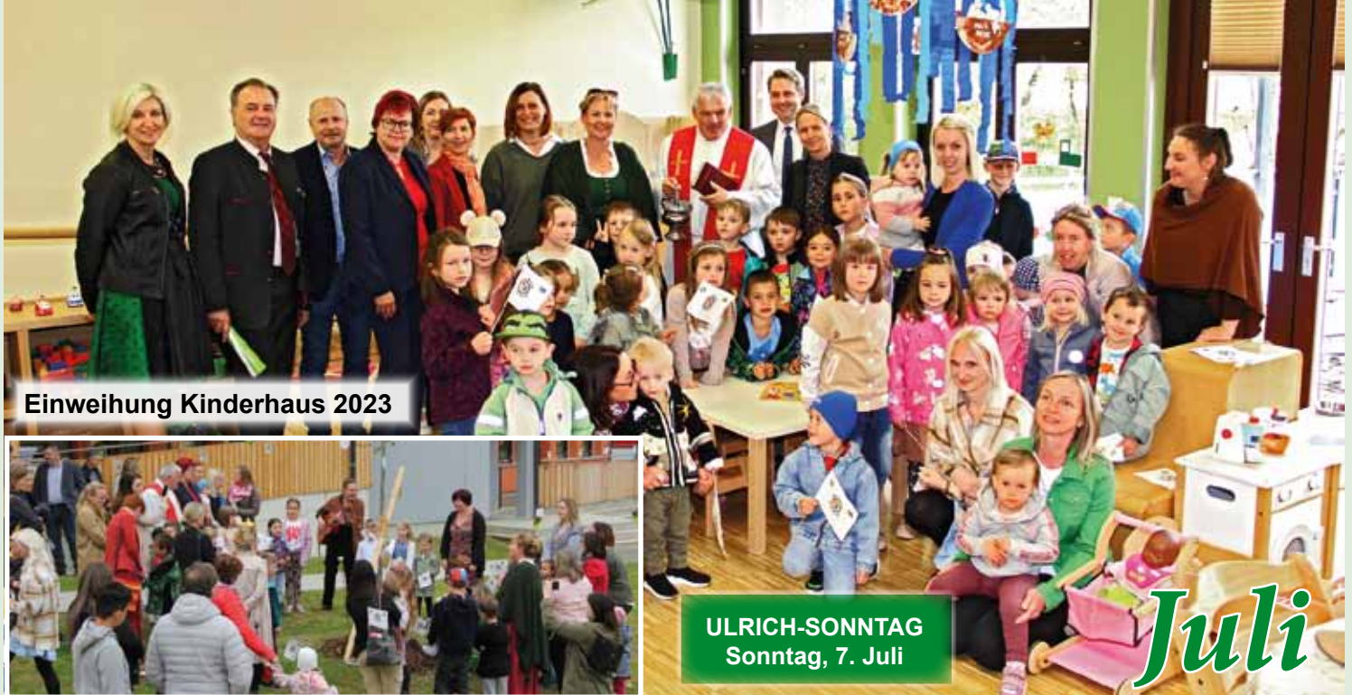
Einweihung Kinderhaus 2023