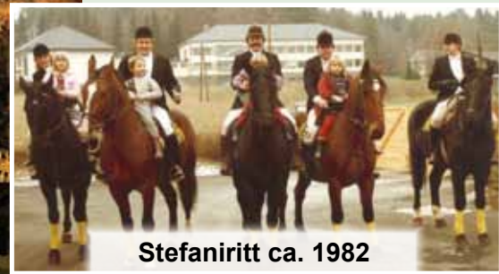
Stefaniritt ca. 1982

FRIEDENSLICHTÜBERGABE 23. Dezember - Marktplatz