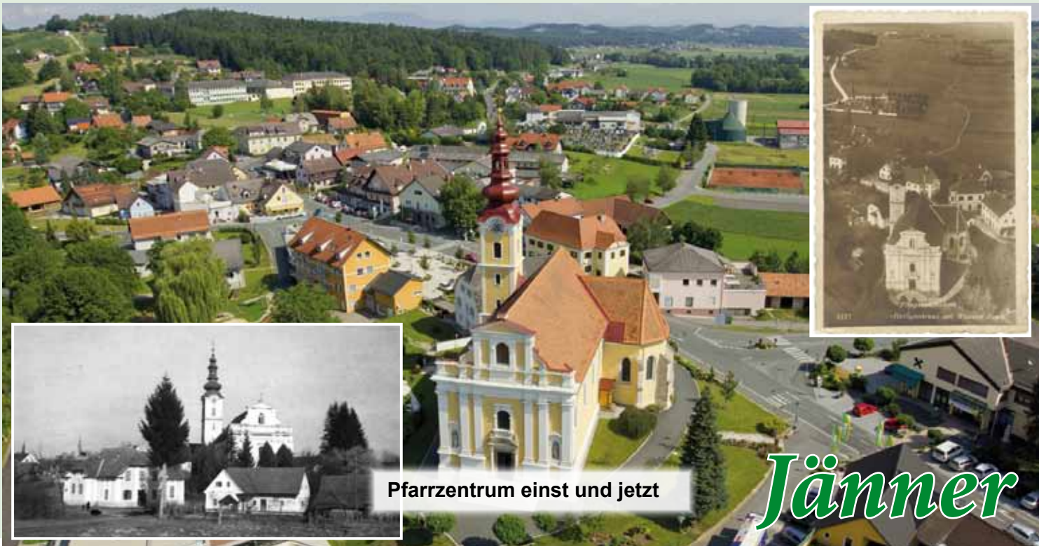
Pfarrzentrum einst und jetzt