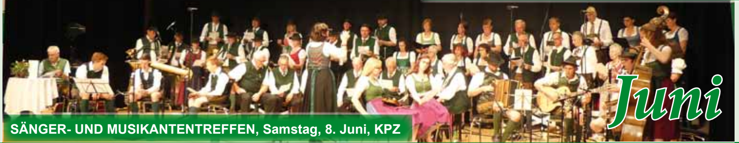
SÄNGER- UND MUSIKANTENTREFFEN, Samstag, 8. Juni, KPZ

STEIRISCHER VORLESETAG & REPAIR-CAFÉ Samstag, 8. Juni, MS Heiligenkreuz/W.