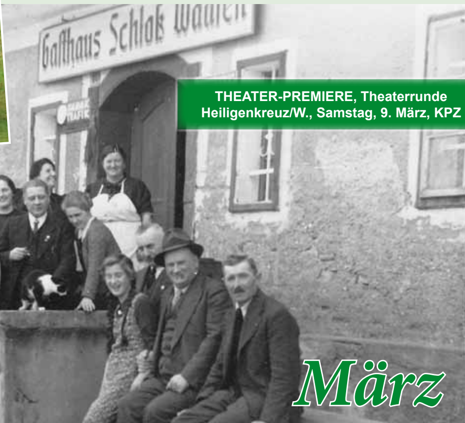
Tatschgerwirt bei Schloss Waasen

THEATER-PREMIERE, Theaterrunde Heiligenkreuz/W., Samstag, 9. März, KPZ