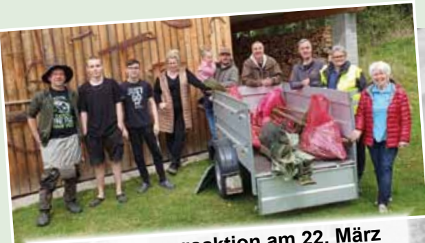
Müllsäuberungsaktion am 22. März