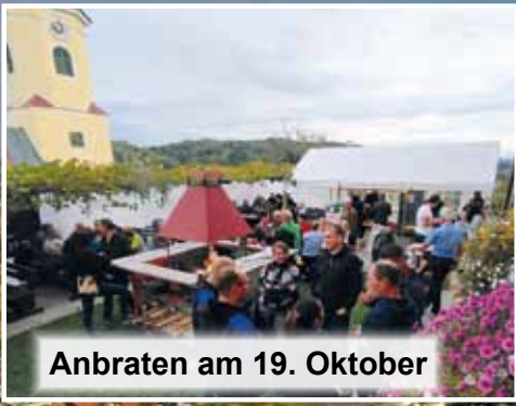
Anbraten am 19. Oktober