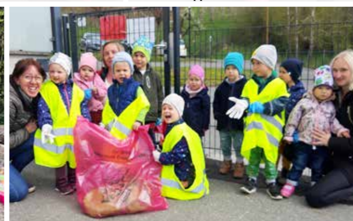
>>> Pfarrkindergarten - Kinderhaus St. Ulrich/W.