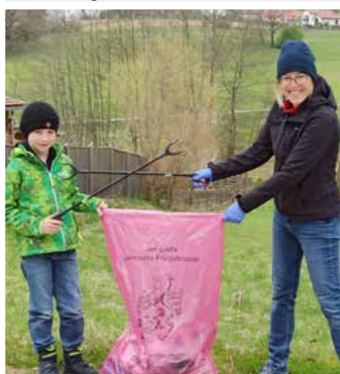
>>> Fam. Pein