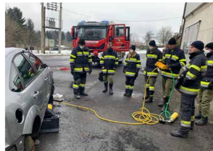
» Schulung auf das neue Fahrzeug

Die Freiwillige Feuerwehr Grossfelgitsch wünscht allen weiterhin viel Kraft und vor allem Gesundheit.