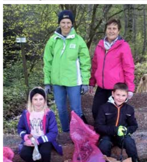
>>> Kath. Bildungswerk