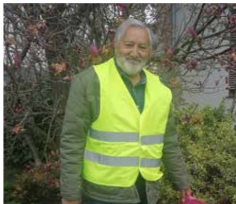
>> ÖKB St. Ulrich/W.