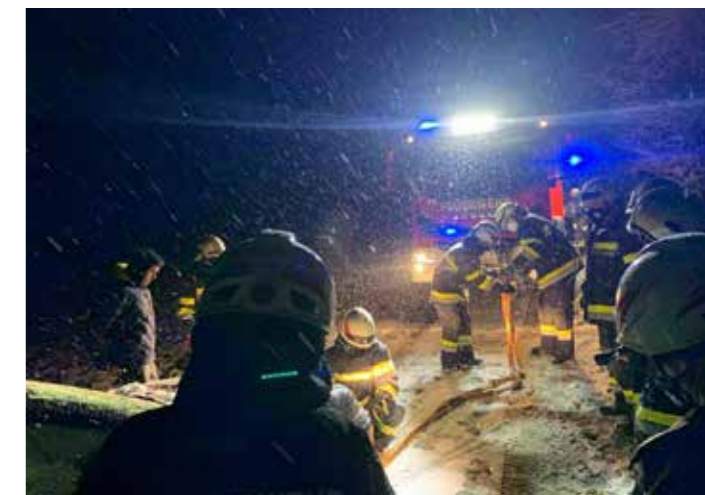
» Der erste Einsatz ließ nicht lange auf sich warten