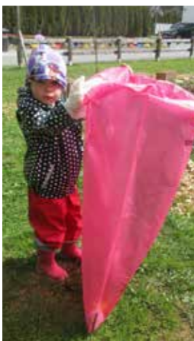
>> Pfarrkindergarten Heiligenkreuz/W.