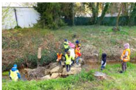
» Aktion „Sauberes Heiligenkreuz/W.“ Großartige Beteiligung