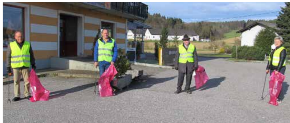
>> ÖKB Heiligenkreuz/W.