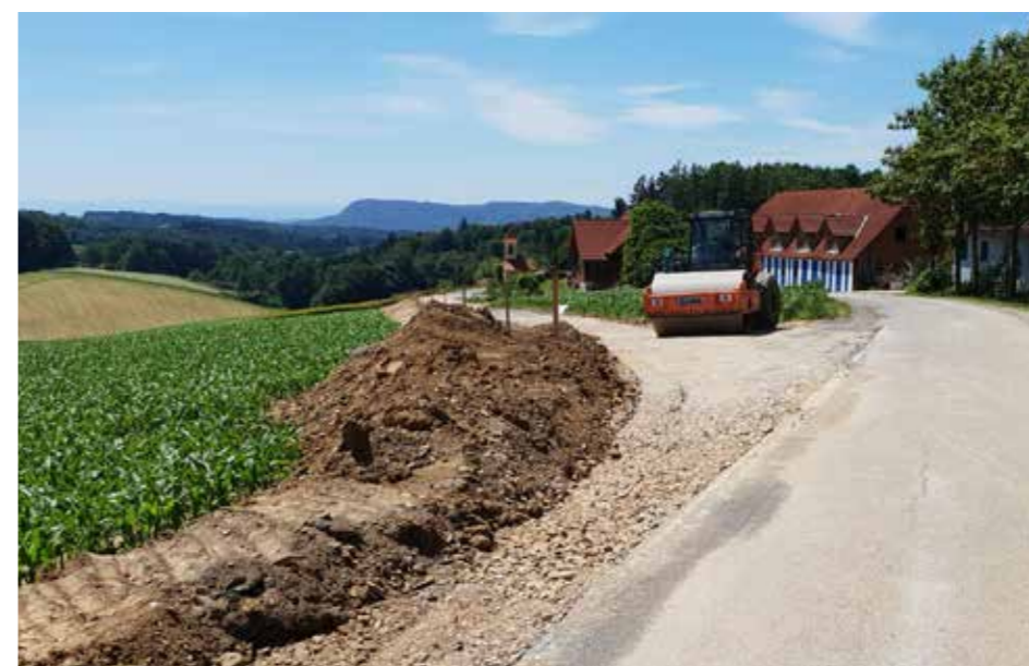
» Turningbergweg - BA03

Ebenso wird die Rutschung im Bereich der Großfelgitschbergstraße auf Höhe der Liegenschaft Hengsberger mit Katastrophenfondsmitteln saniert und die Gemeindeführung in diesem Bereich zur Sicherheit neu mitverlegt.