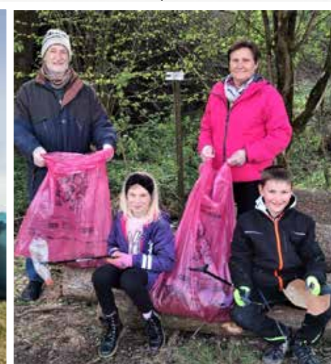
>>> Kath. Bildungswerk