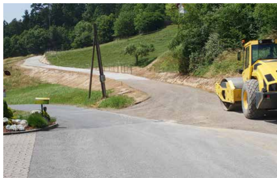
» Siedlungsweg Großfelgitsch-West

Der Abfallwirtschaftsverband Leibnitz (im Besonderen der Obm. Neubauer) entschied sich in seiner letzten Versammlung gegen einen Ressourcenparkstandort in Heiligenkreuz/W., obwohl zahlreiche Voraussetzungen für den Standort in der Leibnitzer Straße (im Anschluss an das ASZ) mit eigener Abbiegespur von der Landesstraße u. Erfüllung weiterer Aufschließungsanforderungen gegeben waren. Den Zuschlag erhielt die Gemeinde Allerheiligen/W. mit dem Standort in Schwasdorf.