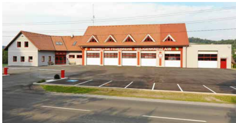
» Ausbau des Feuerwehrhauses Heiligenkreuz am Waasen abgeschlossen

Sehr erfreulich kann der Abschluss der Ausbaumaßnahmen – Bauabschnitt – BA02 - beim Feuerwehrhaus Heiligenkreuz am Waasen vermeldet werden. Der Spatenstich erfolgte am 11.02.2019. Seit dieser Zeit wurde mit sehr viel Engagement und Eigeninitiativen und trotz Covid-19-Einschränkungen die Nutzfläche für den laufenden Betrieb und für die Einsatzbereitschaft „verdoppelt“. Dies ist straßenseitig nur teilweise sichtbar, da die Erweiterung im Wesentlichen auf der Rückseite (Stiefingstraße) erfolgt ist. Die Marktgemeinde sowie die Feuerwehrleitung mit HBI Pichler und OBI