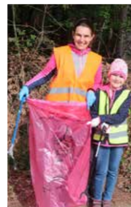
>>> Fam. Wagner