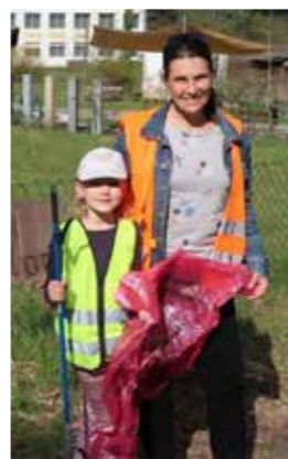
>>> Fam. Spandl und Scheucher