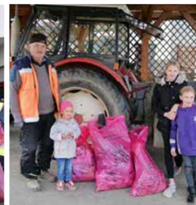
>>> Fam. Kainz