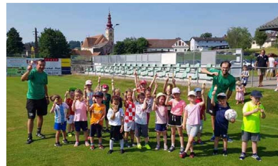
» Trainingsstart beim Fußball-Nachwuchs

Für die Kinder und Schüler berufstätiger Eltern wurde in Zusammenarbeit mit der Gemeinde Pirching/Tr. eine umfassende Ferienbetreuung aufgestellt – die Anmeldungen dazu sind zahlreich erfolgt.