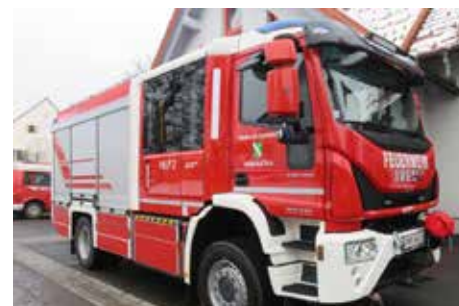
» Tanklöschfahrzeug HLF2 für die FF Großfelgitsch