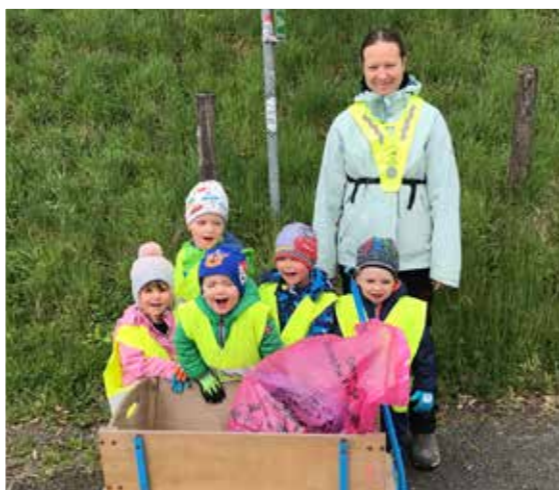
>> Tagesmutter Altenburger