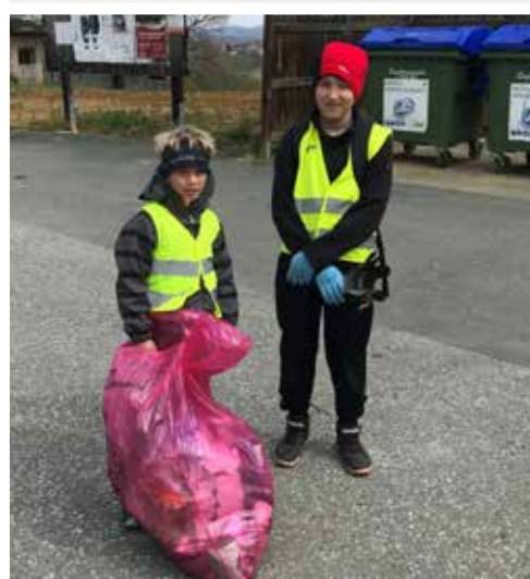
>>> Fam. Altenburger