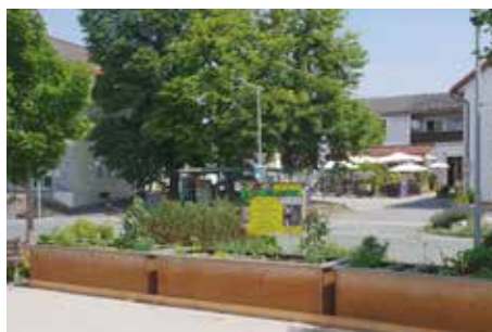
» Essbare Gemeinde Neue Hochbeete am Marktplatz