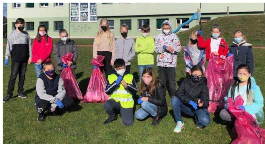
>> Volksschule Heiligenkreuz/W.