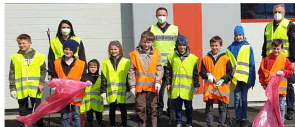
>>> Freiwillige Feuerwehr Heiligenkreuz am Waasen