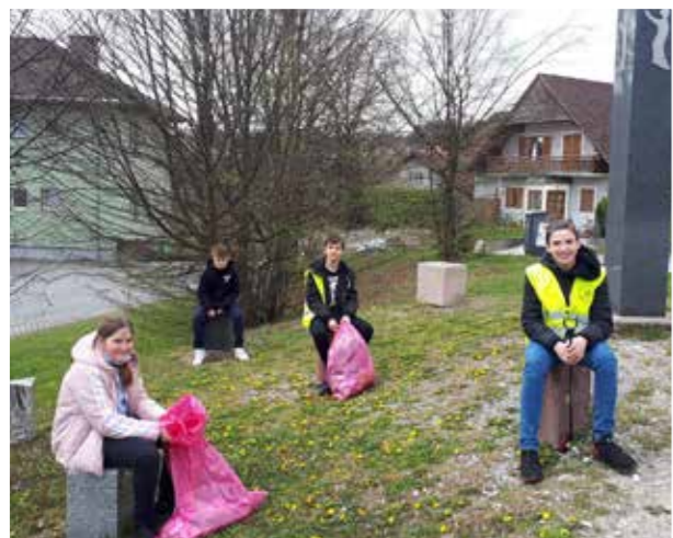
>> Mittelschule Heiligenkreuz/W.